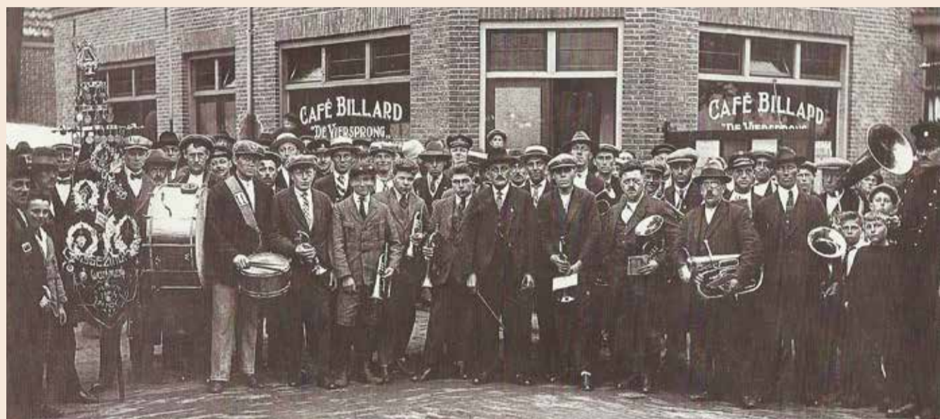
Foto: Fanfarekorps Eensgezindheid werd op 27 mei 1926 gehuldigd voor Café Billard de Viersprong

Bezoek diverse exposities met het thema "Plekken van plezier"