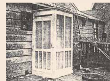
Huis in Oost-Knollendam ná bescherming met gaas tegen de malariamug

Geïnspireerd door Celli experimenteerde Schoo in Oost-Knollendam. Er werden in maart 1902 10 huizen van horren en gaasbescherming voorzien. Daarna deden zich in deze huizen geen gevallen van