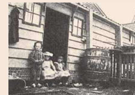
Huis in Oost-Knollendam vóór bescherming met gaas tegen de malariamug