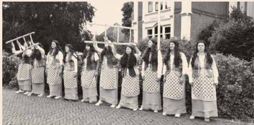
Foto rechts: In de Jisperkerk veel aandacht voor de sprankelende theatervoorstelling van de ledezitters

Daarnaast is er een mogelijkheid prachtige stoffen te kopen en boeken met het doel gelden te verwerven voor de noodzakelijke nieuwe fundering van de Jisperkerk.